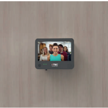
Funciona con los siguientes programas.

iViewer 10 Wifi La nueva pantalla digital WiFi está diseñada para ofrecerle la solución de seguridad doméstica definitiva. Con una instalación fácil y sin necesidad de tender cables, junto con una configuración sencilla y rápida, es un complemento de seguridad para su puerta.